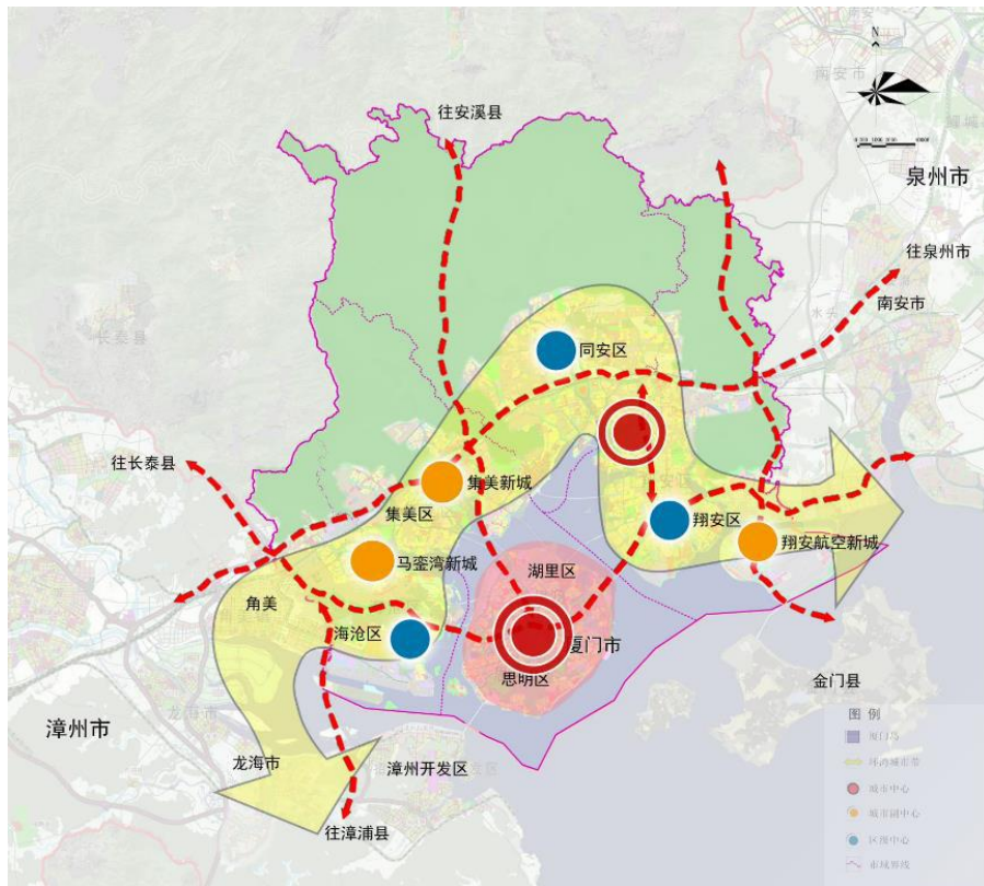
图 4 城市空间结构图

发挥集美新城教育科研、交通枢纽、软件信息、文化演艺旅游、高端制造等功能；发挥翔安航空新城国际交通枢纽、物流等功能，辐射带动泉州、金门。强化区级中心的综合服务功能，承载服务各区的公共服务、商业服务、商务办公、创新创业功能，促进岛外功能完善和服务水平提升。