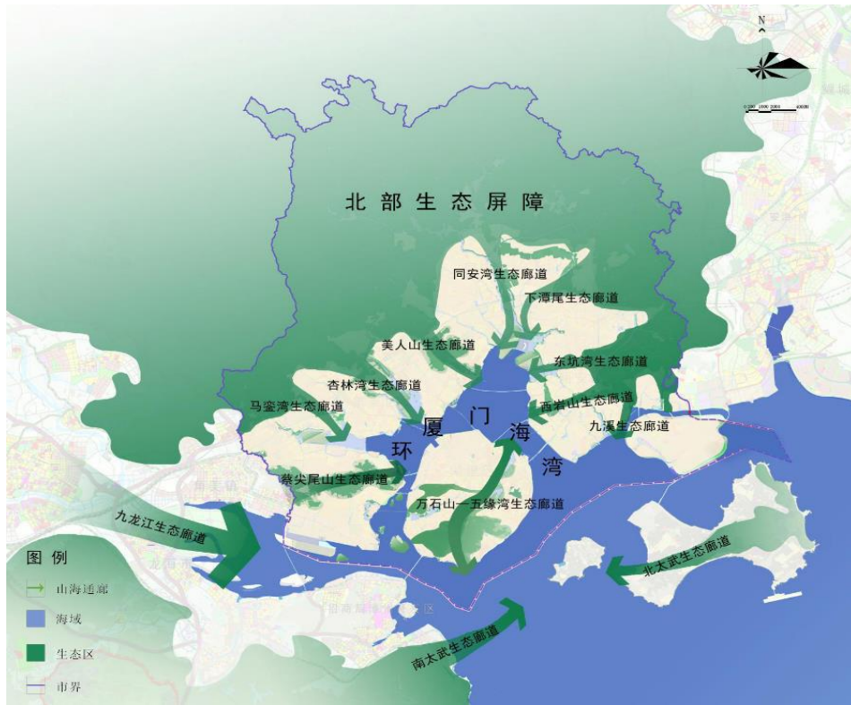
图 7 全域生态格局图

开展滨海岸线整治提升与湿地的生态保护和修复。实施海堤生态化建设和改造，修复受损岸线，提升海岸生态功能和抵御海洋灾害的能力。实行湿地分级管理，完善湿地保护管理体系。保护中华白海豚、文昌鱼、白鹭等珍稀物种，提高生物多样性。