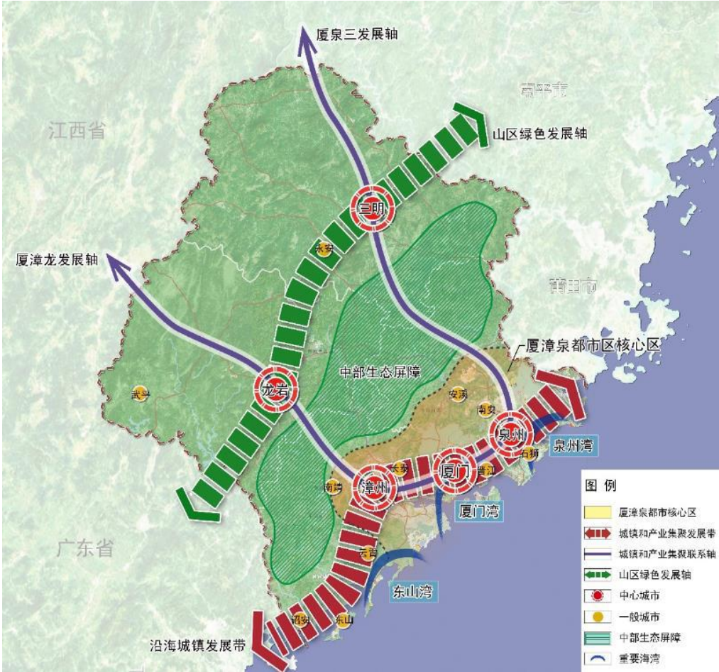
图 3 闽西南协同发展区空间结构图

港布局建设。加快推进厦漳、厦泉、厦明和厦龙经济合作区建设，创新园区合作开发模式，建立利益共享机制。以经济合作区共建为载体，开展跨市联合招商，引导产业链跨市布局，打造区域优势产业链群。集聚整合区域科技、产业、金融、人才等各类资源，打造智能制造共享、科技金融创新、旅游营销、人力资源信息、交通物流服务、医疗卫生信息共享等平台。强化生态保护与修复，共同打造区域生态安全格局。深化东西部协作、对口支援和省内山海协作，巩固脱贫攻坚成果。