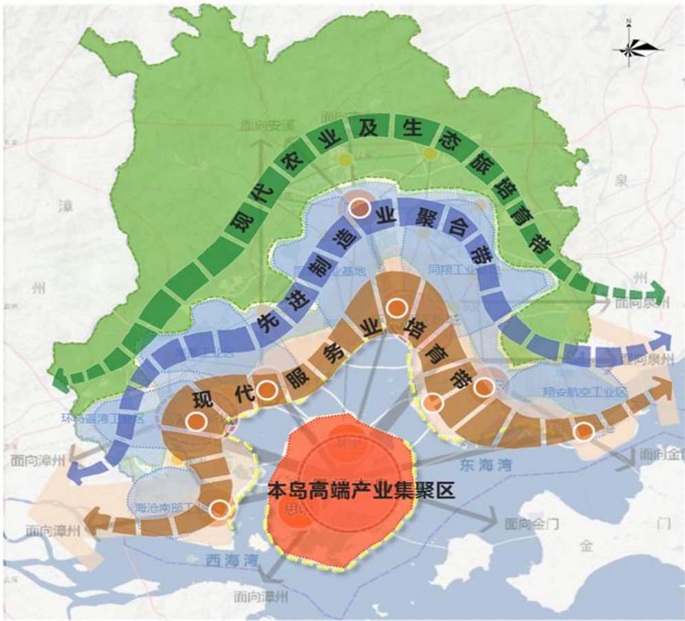
图 1 全市产业布局结构图