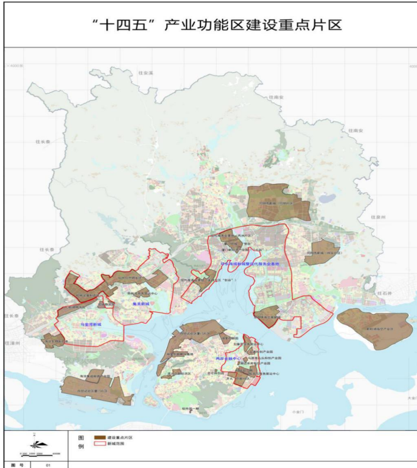
图2 “十四五”产业功能区建设重点片区图

欧厝海洋高新产业园区。打造集科研、创新、孵化、产业为一体的产学研园区，重点引进国内外知名海洋企业总部。