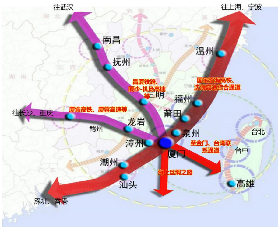
图 5 区域空间发展策略图

和海上合作战略支点建设,率先实现与台湾尤其是金门的基础设施应通尽通。西拓:积极拓展内陆腹地空间,促进闽西南区域协同发展,并将腹地空间拓展到南昌、武汉、长沙、重庆等中西部地区。南联:依托高速公路、沿海铁路和海空信息重要港口,实现与粤港澳大湾区联动发展。北延:以重大合作平台为载体,依托沿海高速公路、铁路,积极融入长三角城市群,参与区域分工协作。